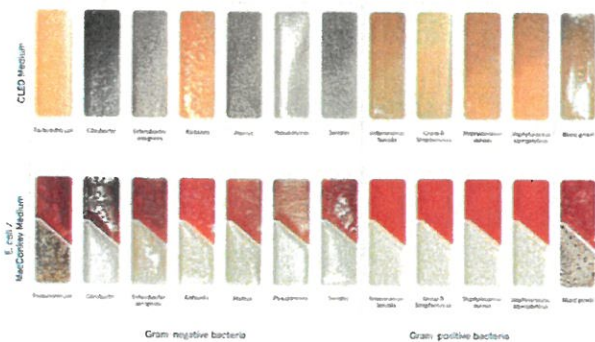
Uricult ® Trio – modelové schéma

Video a více materiálů: www.uricult.cz (dokumenty ke stažení).